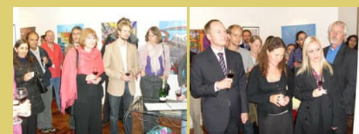
Parte de los invitados al evento.